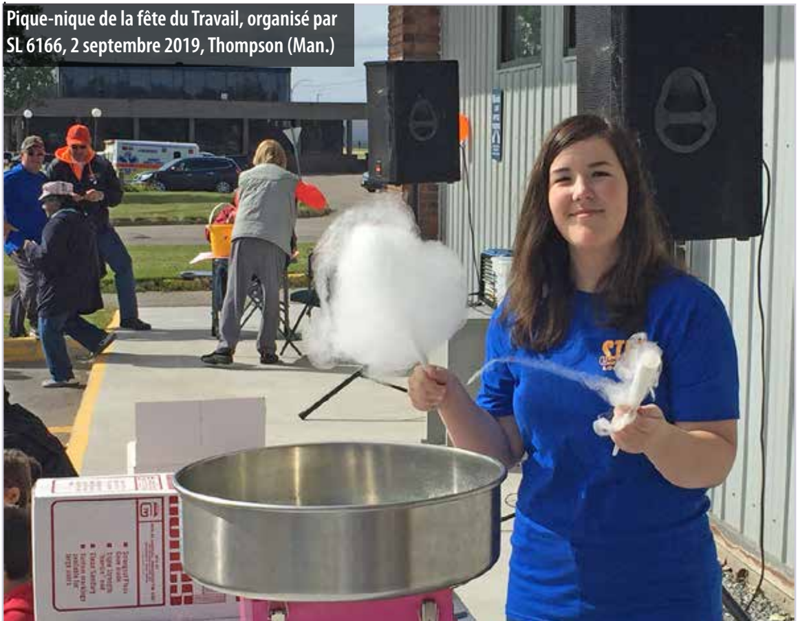
Pique-nique de la fête du Travail, organisé par SL 6166, 2 septembre 2019, Thompson (Man.)

Il importe de souligner le travail des coordonnatrices de l'éducation des districts et du sous-comité d'examen des projets qui ont eu à prendre des décisions difficiles. Nous ne devons pas non plus oublier que le succès de tous ces projets dépend de la créativité, de l'engagement et du travail bénévole des sections locales et de leurs militantes et militants. Grâce à eux, les activités du Syndicat des Métallos continueront de prospérer et de profiter à nos membres, leurs familles et leurs collectivités à l'avenir.