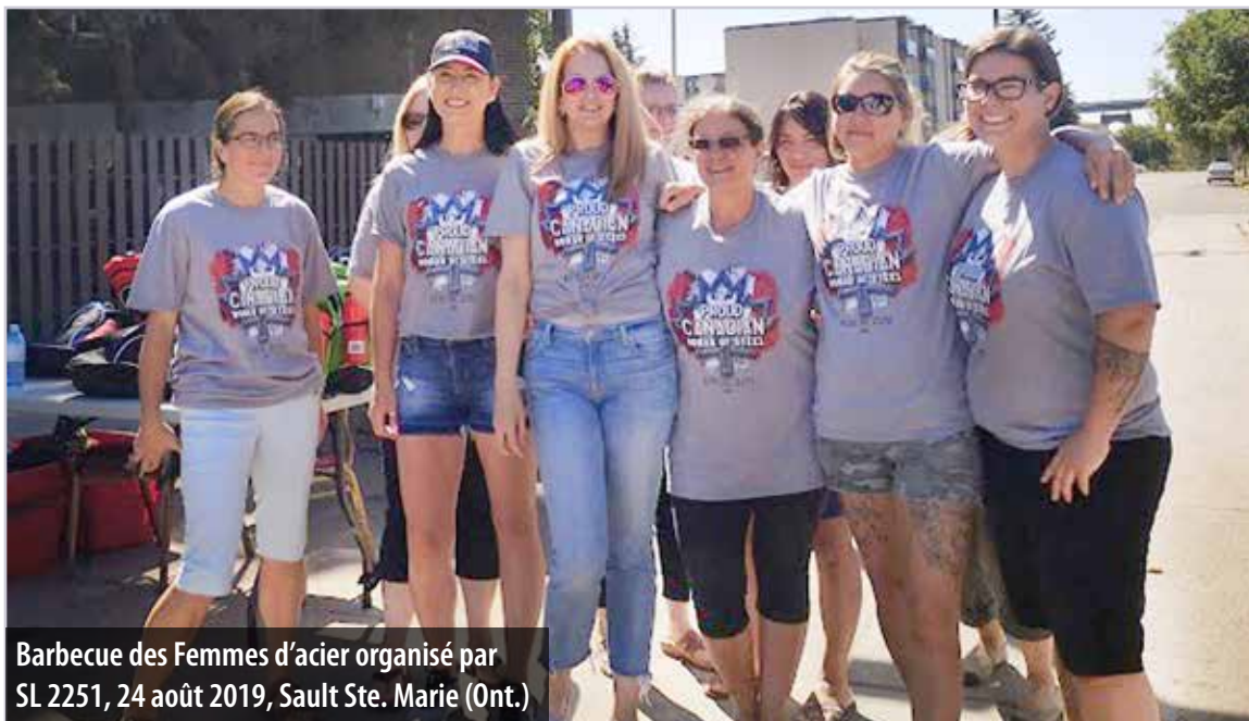
Barbecue des Femmes d'acier organisé par SL 2251, 24 août 2019, Sault Ste. Marie (Ont.)