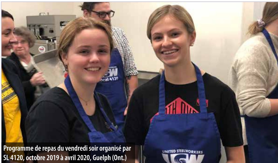
Programme de repas du vendredi soir organisé par SL 4120, octobre 2019 à avril 2020, Guelph (Ont.)