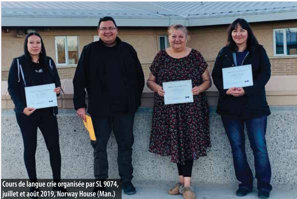
Cours de langue crie organisée par SL 9074, juillet et août 2019, Norway House (Man.)