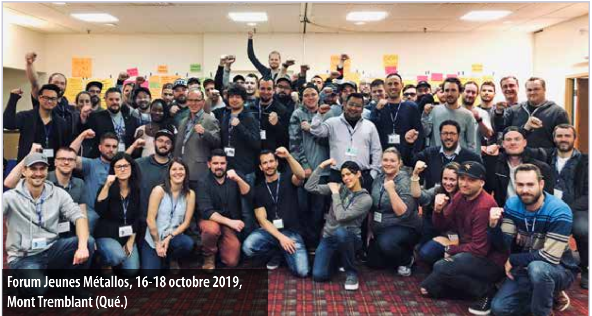
Forum Jeunes Métallos, 16-18 octobre 2019, Mont Tremblant (Qué.)