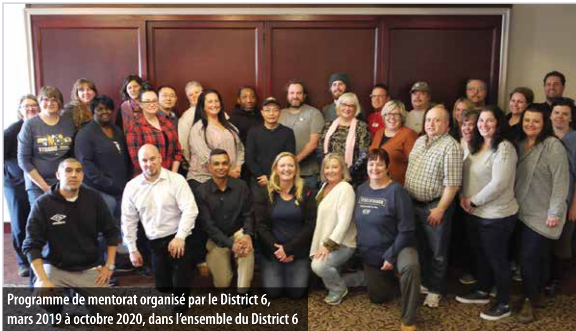
Programme de mentorat organisé par le District 6, mars 2019 à octobre 2020, dans l'ensemble du District 6

Le programme jumelle des apprenants à des mentors en fonction des objectifs d'apprentissage et des forces de chacun. Pendant une séance d'orientation de deux jours, les partenaires du mentorat font d'abord connaissance, créent des liens, apprennent des techniques de communication et dressent un plan d'apprentissage. Par la suite, ils communiquent par téléphone, Skype ou une autre plateforme une fois par mois pendant les douze mois suivants.