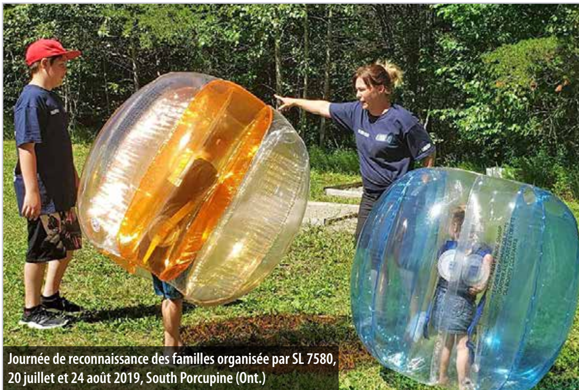
Journée de reconnaissance des familles organisée par SL 7580, 20 juillet et 24 août 2019, South Porcupine (Ont.)