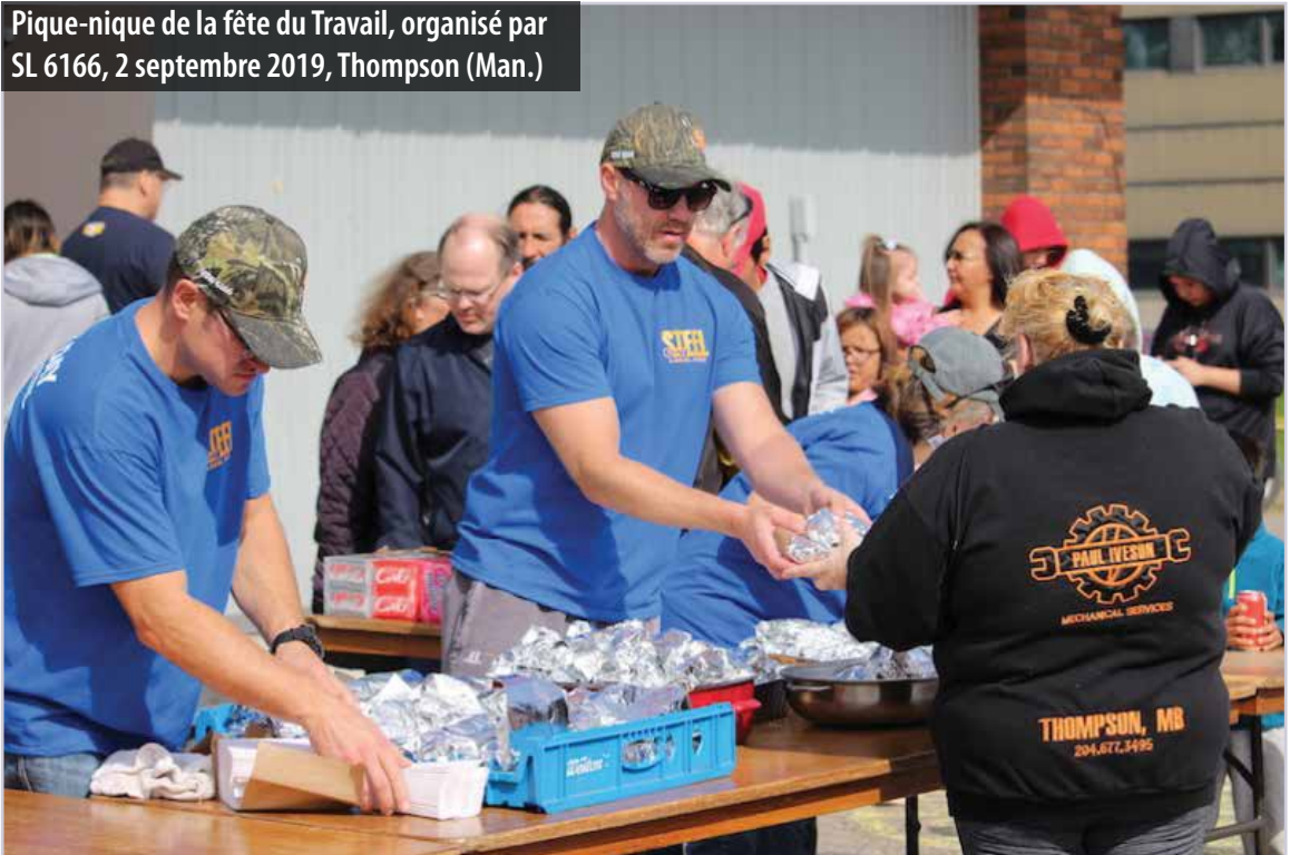
Pique-nique de la fête du Travail, organisé par SL 6166, 2 septembre 2019, Thompson (Man.)

Pendant le congé annuel de septembre, la SL 6166 a célébré les réalisations des travailleurs par un barbecue et des activités pour les enfants. Elle en a profité pour y distribuer de la documentation et effectuer un sondage sur notre syndicat. Des dirigeants des Métallos, responsables politiques et autres invités y ont pris la parole.