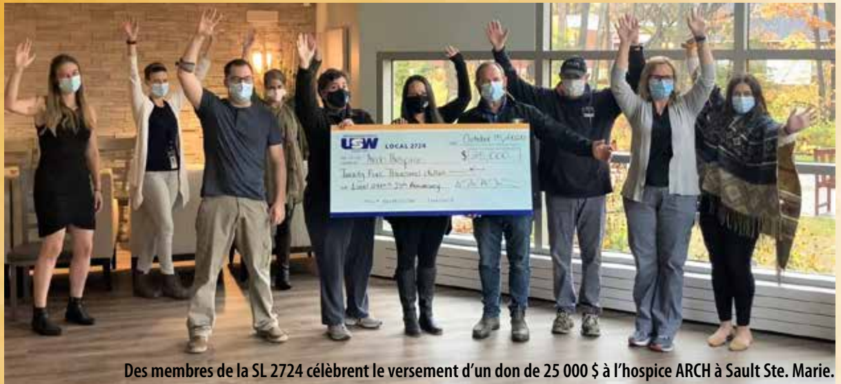
Des membres de la SL 2724 célèbrent le versement d'un don de 25 000 $ à l'hospice ARCH à Sault Ste. Marie.

La SL 2724 des Métallos, représentant les employés de bureau, techniques et professionnels, les coordonnateurs de quarts, les planificateurs et les superviseurs immédiats chez Algoma Steel, a célébré son 25 e anniversaire en grand, faisant don de 100 000 $ à plusieurs organismes caritatifs, y compris 25 000 $ à ARCH Hospice.