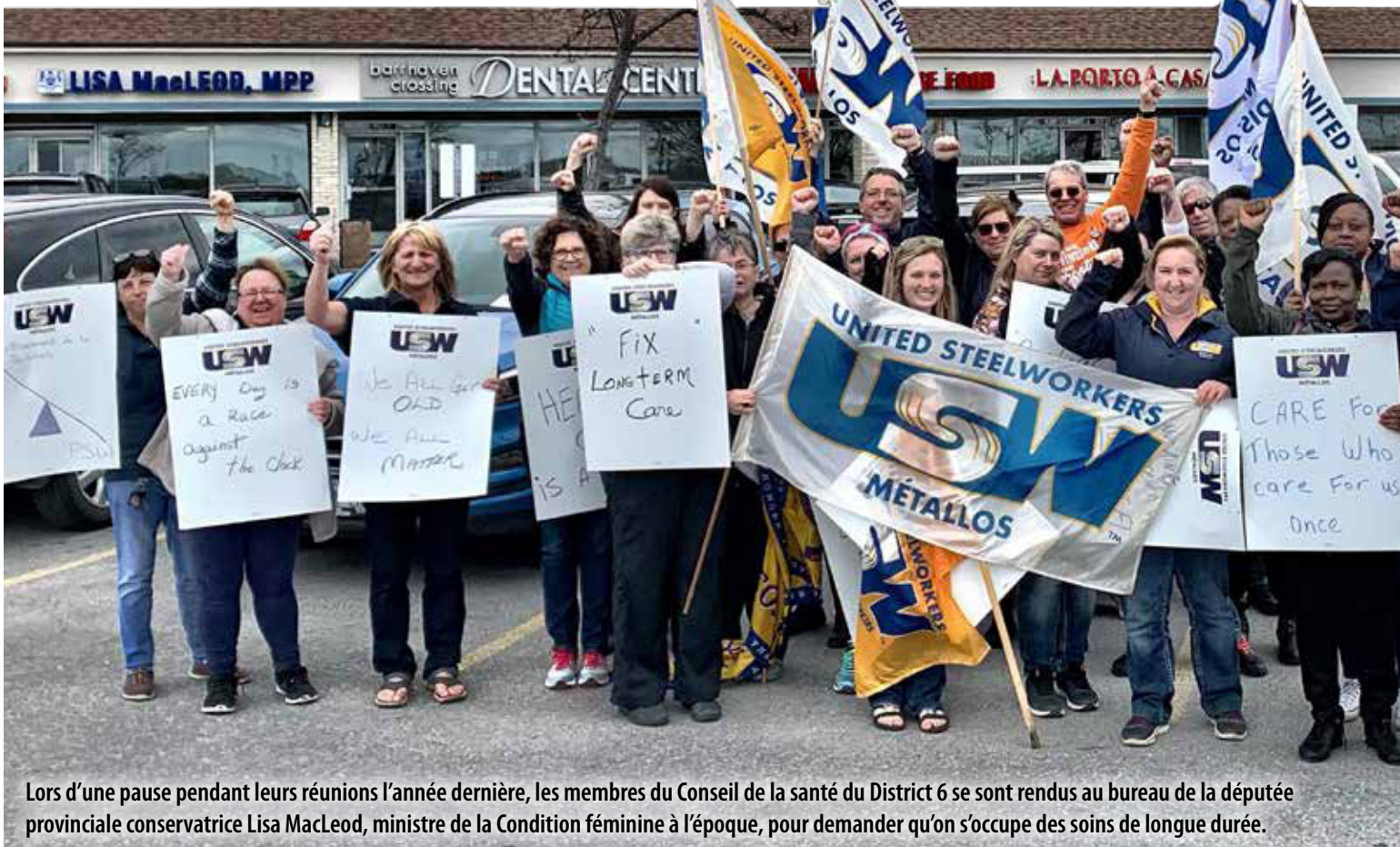
Lors d'une pause pendant leurs réunions l'année dernière, les membres du Conseil de la santé du District 6 se sont rendus au bureau de la députée provinciale conservatrice Lisa MacLeod, ministre de la Condition féminine à l'époque, pour demander qu'on s'occupe des soins de longue durée.

Le conseil a lancé un projet pilote de recrutement et de formation de travailleurs avec un bureau de placement de