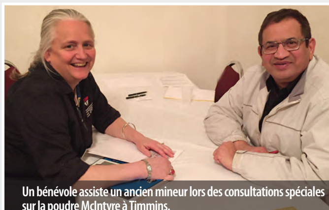
Un bénévole assiste un ancien mineur lors des consultations spéciales sur la poudre McIntyre à Timmins.

«Notre objectif est de prouver que les personnes soumises à cette pratique méritent d'être dédommagées par la Commission de la sécurité professionnelle et de l'assurance contre les accidents du travail (CSPAAT)», a-t-il expliqué.