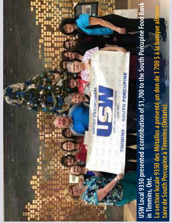
USW Local 9350 presented a contribution of $1,700 to the South Porcupine Food Bank in Timmins, Ont. La section locale 9350 des Métallos a présenté un don de 1 700 $ à la banque alimentaire de South Porcupine à Timmins (Ontario).