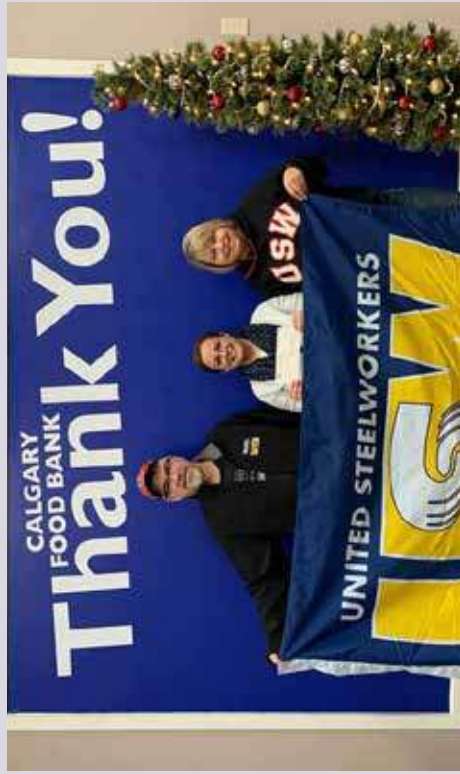
USW Local 7226, Local 1-207 and the USW Southern Alberta Area Council supported the Calgary Food Bank on behalf of the Steelworkers Humanity Fund. Les sections locales 7226 et 1-207, et le conseil régional du Sud de l'Alberta des Métallos ont appuyé la banque alimentaire de Calgary au nom du Fonds humanitaire.

www.metallos/humanitaire #métallossontlà