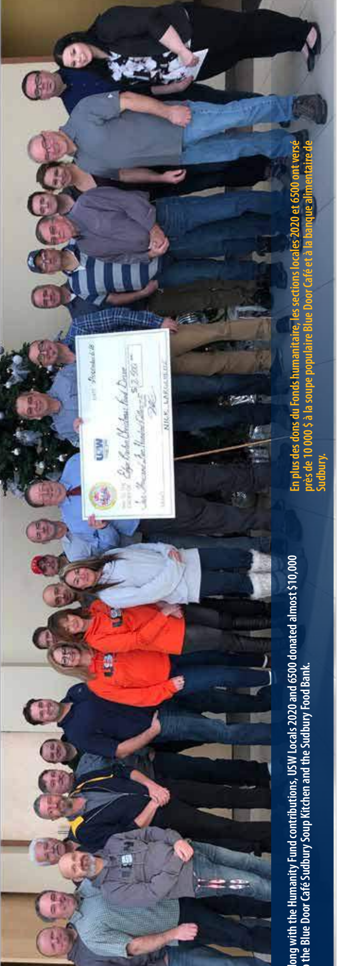
Along with the Humanity Fund contributions, USW Locals 2020 and 6500 donated almost $10,000 to the Blue Door Café Sudbury Soup Kitchen and the Sudbury Food Bank.