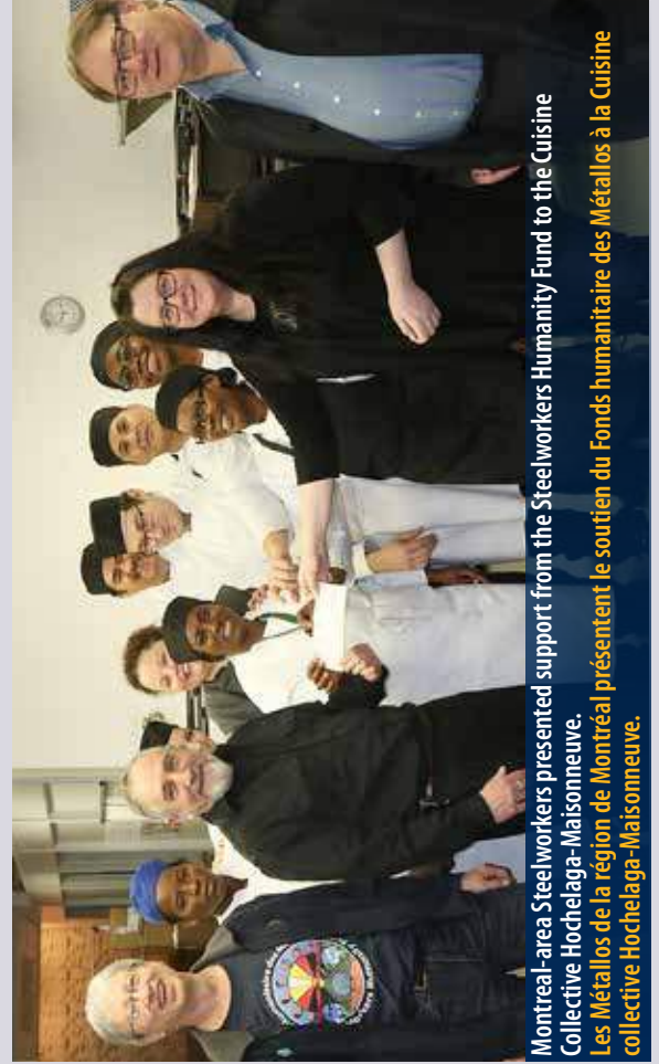
Montreal-area Steelworkers presented support from the Steelworkers Humanity Fund to the Cuisine Collective Hochelega-Maisonneuve. Les Métallos de la région de Montréal présentent le soutien du Fonds humanitaire des Métallos à la Cuisine collective Hochelega-Maisonneuve.