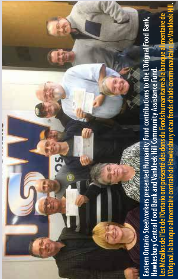
Eastern Ontario Steelworkers presented Humanity Fund contributions to the L'Original Food Bank, Hawkesbury Central Food Bank and Vankeek Hill Community Assistance Fund. Les Métallos de l'Est de l'Ontario ont présenté des dons du Fonds humanitaire à la banque alimentaire de L'Original, la banque alimentaire centrale de Hawkesbury et au fonds d'aide communautaire de Vankeek Hill.