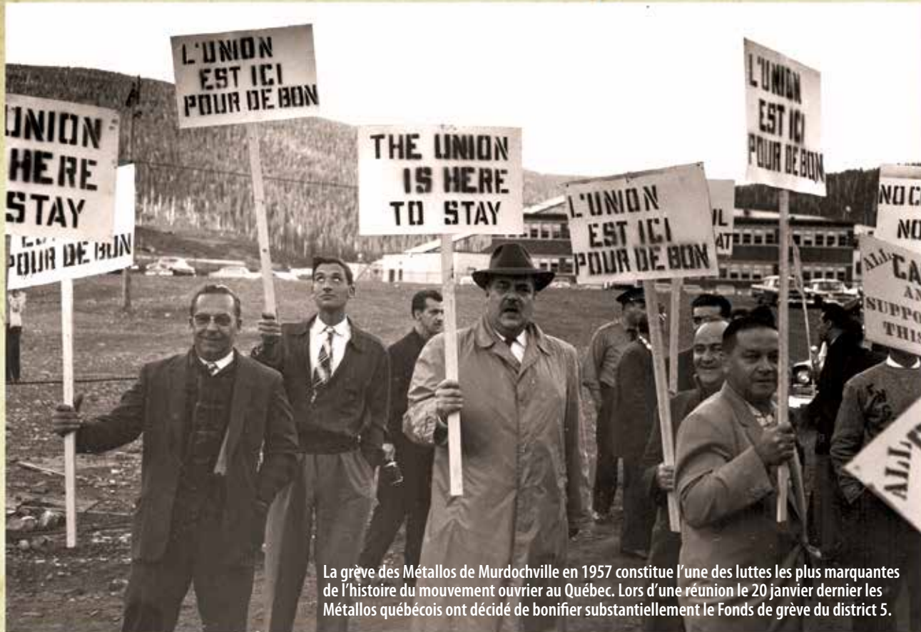
La grève des Métallos de Murdochville en 1957 constitue l'une des luttes les plus marquantes de l'histoire du mouvement ouvrier au Québec. Lors d'une réunion le 20 janvier dernier les Métallos québécois ont décidé de bonifier substantiellement le Fonds de grève du district 5.