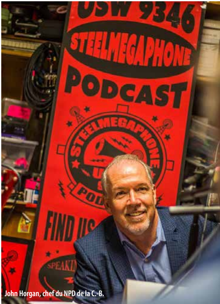
John Horgan, chef du NPD de la C.-B.

Élire un gouvernement au service de la population ouvrière