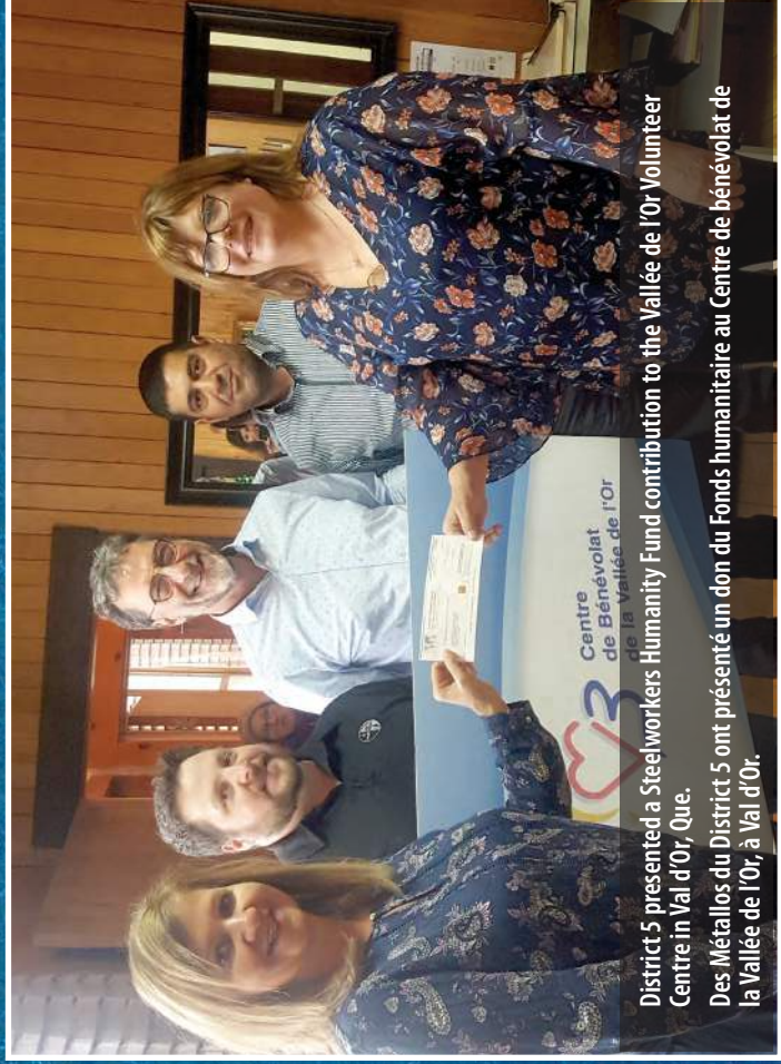
District 5 presented a Steelworkers Humanity Fund contribution to the Vallée de l'Or-Volunteer Centre in Val d'Or, Que.

Faites connaître votre travail communautaire sur Facebook ou Twitter en utilisant #MétallosSontLà.