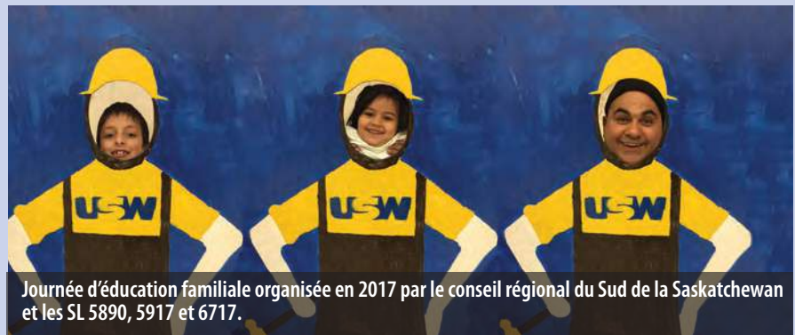
Journée d'éducation familiale organisée en 2017 par le conseil régional du Sud de la Saskatchewan et les SL 5890, 5917 et 6717.

Le Fonds d'éducation familiale et communautaire a soutenu des projets comme les stages d'été, les journées d'éducation familiale et les subventions à la Prochaine génération, et il vise désormais quatre objectifs :