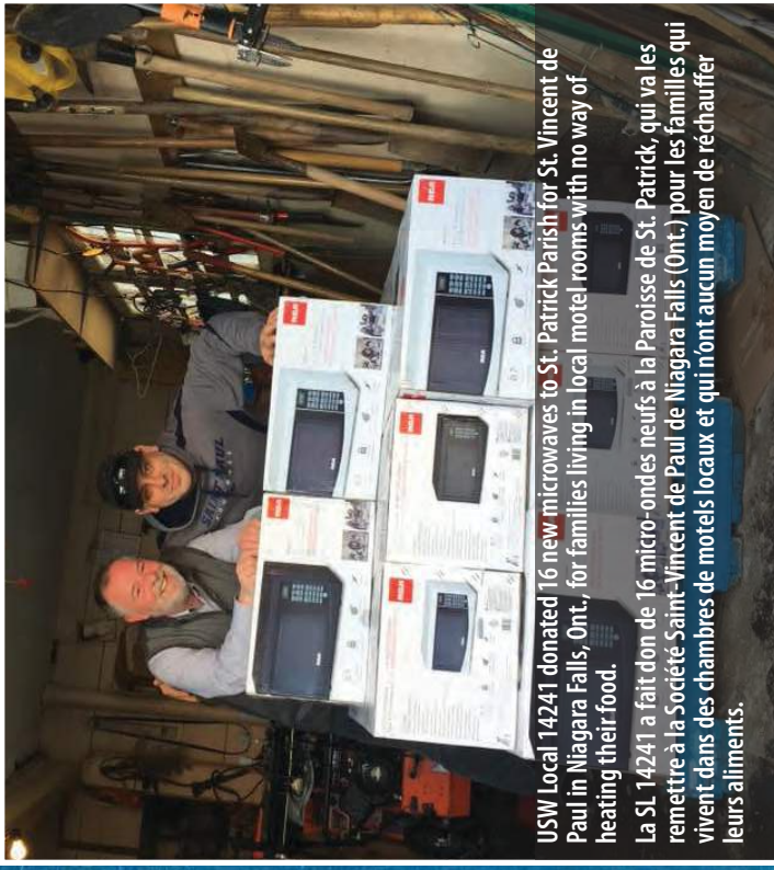
USW Local 14241 donated 16 new microwaves to St. Patrick Parish for St. Vincent de Paul in Niagara Falls, Ont., for families living in local motel rooms with no way of heating their food.