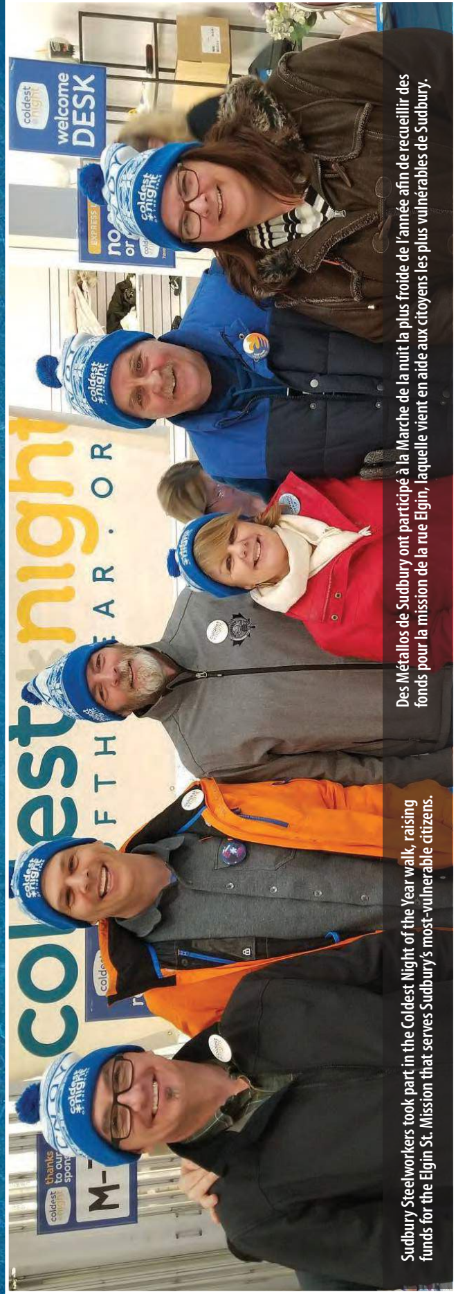
Sudbury Steelworkers took part in the Coldest Night of the Year walk, raising funds for the Elgin St. Mission that serves Sudbury's most-vulnerable citizens.