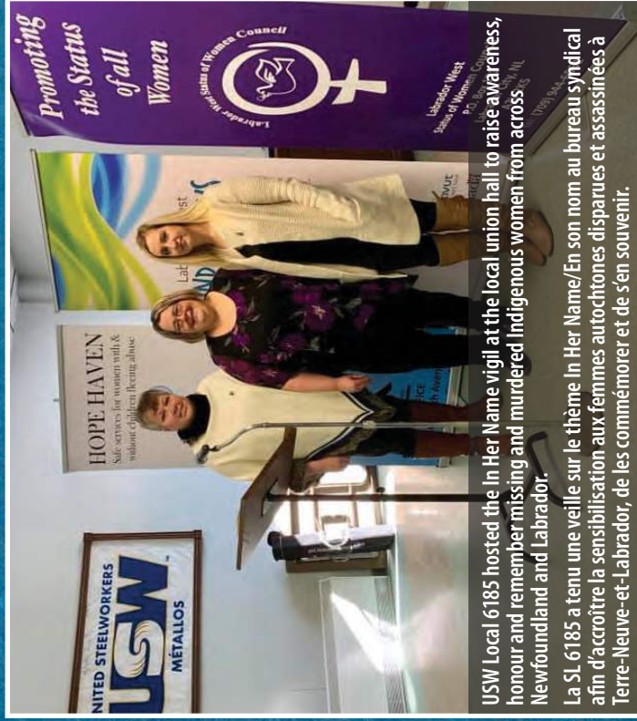
USW Local 6185 hosted the In Her Name vigil at the local union hall to raise awareness, honour and remember missing and murdered Indigenous women from across Newfoundland and Labrador.

La SL 6185 a tenu une veille sur le thème In Her Name/En son nom au bureau syndical afin d'accroître la sensibilisation aux femmes autochtones disparues et assassinées à Terre-Neuve-et-Labrador, de les commémorer et de s'en souvenir.