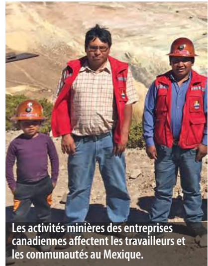
Les activités minières des entreprises canadiennes affectent les travailleurs et les communautés au Mexique.

«Le gouvernement a trahi les Canadiens et les personnes vulnérables des pays en développement qui s'attendaient à des mesures sérieuses sur les droits de