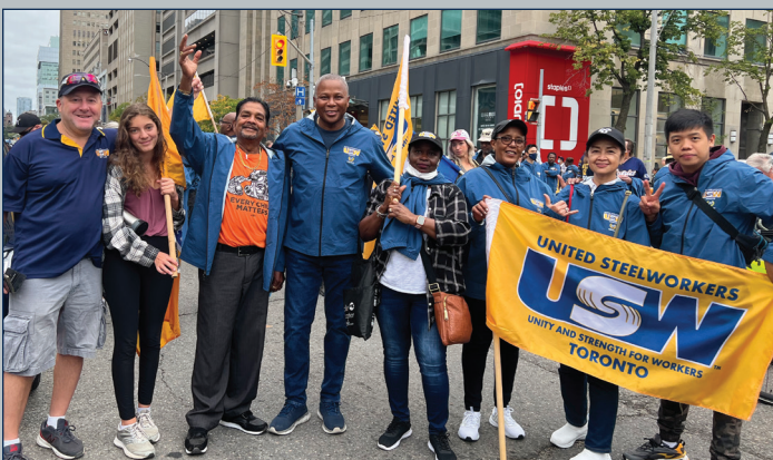
Des membres du Syndicat des Métallos se rassemblent pour le défilé de la fête du Travail à Toronto.