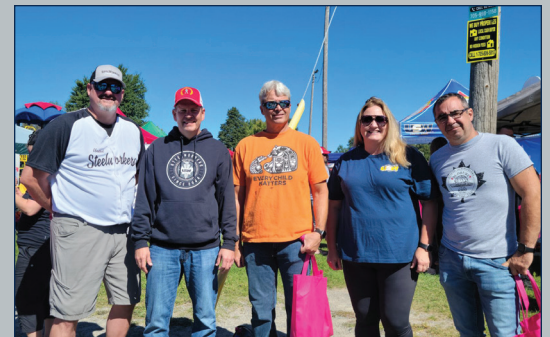
Des membres des Métallos se rassemblent pour les célébrations de la fête du Travail à Sudbury, (Ont.)