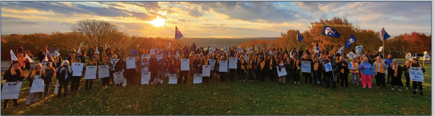
Des femmes d'acier de partout au Canada, dont de nombreux membres du District 6, ont protesté contre la violence fondée sur le sexe lors d'un événement à l'aube (Qué.)