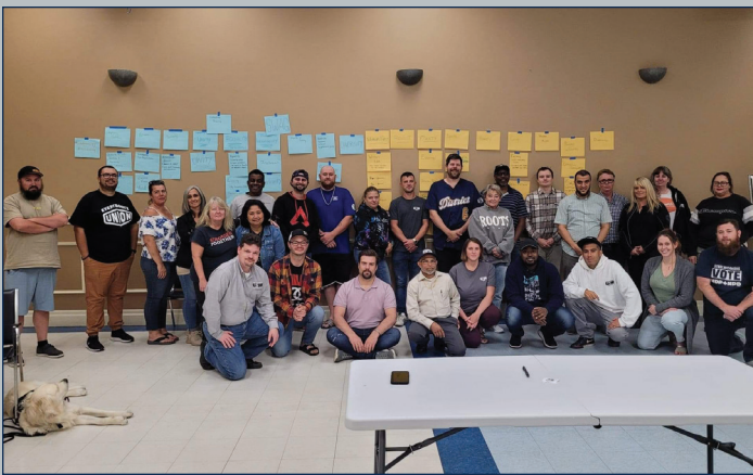
Les membres des comités du District 6 de l'USW se sont réunis en septembre pour une journée de formation et de collaboration.