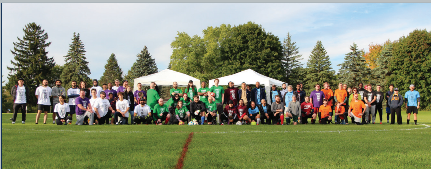
Le comité de la Prochaine génération du District 6 a organisé un tournoi de soccer de sept équipes à Ingersoll, (Ont.) en octobre.