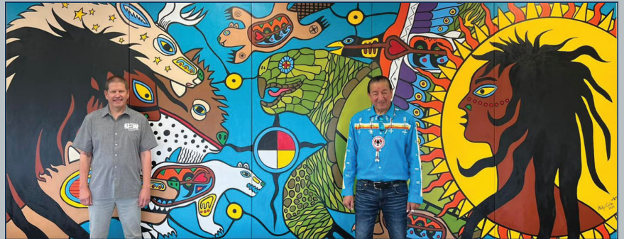
Le District 6 des Métallos est honoré d'exposer la murale de l'artiste autochtone Philip Cote à notre bureau d'Etobicoke, (Ont.) « The Original Family » est une représentation de l'histoire de la création des Ojibway/Anishinaabe, qui a été transmise par des traditions orales et des images peintes sur des rouleaux d'écorce de bouleau.