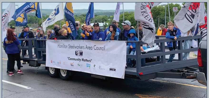
Des métallos défilent lors du défilé de la fête du Travail à Hamilton (Ont.)