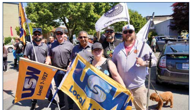
Des militants du District 3 participent à une manifestation pour soutenir les membres travaillant dans le secteur de l'aquaculture sur l'île de Vancouver.