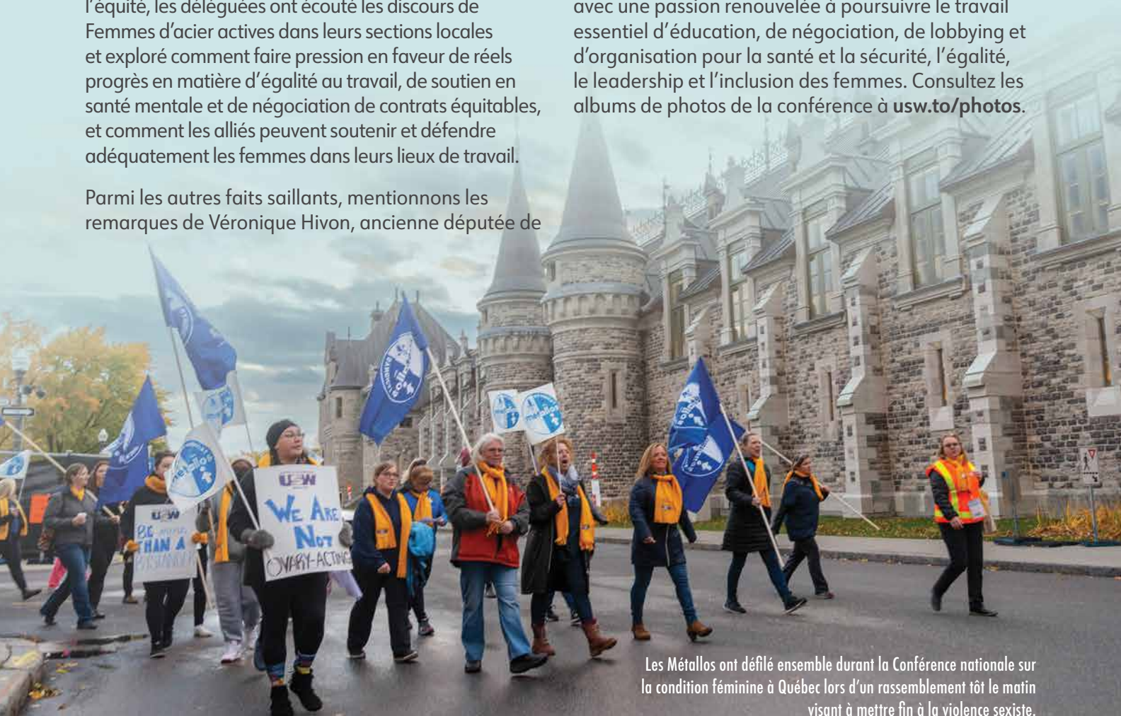
Les Métallos ont défilé ensemble durant la Conférence nationale sur la condition féminine à Québec lors d'un rassemblement tôt le matin visant à mettre fin à la violence sexiste.

Pendant trois jours, le syndicat a poursuivi sa tradition d'innovation en matière de questions relatives à la condition féminine, et les participantes sont reparties avec une passion renouvelée à poursuivre le travail essentiel d'éducation, de négociation, de lobbying et d'organisation pour la santé et la sécurité, l'égalité, le leadership et l'inclusion des femmes. Consultez les albums de photos de la conférence à usw.to/photos .