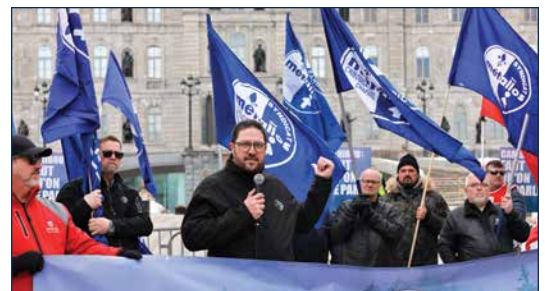
Ensemble, les Métallos se mobilisent pour poursuivre la lutte pour une loi anti-scabs au fédéral.