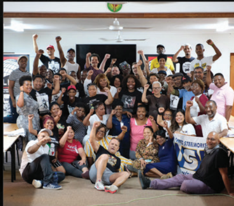
Les membres de la délégation Métallos avec le personnel d'ILRIG et des participants à l'école politique.