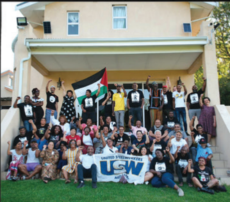
Les membres de la délégation Métallos avec le personnel d'ILRIG et des participants à l'école politique.