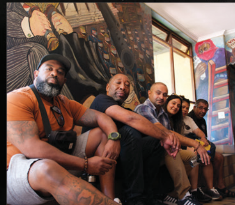
Les membres de la délégation Métallos à la maison commune, une plateforme pour les organisations progressistes à Le Cap.