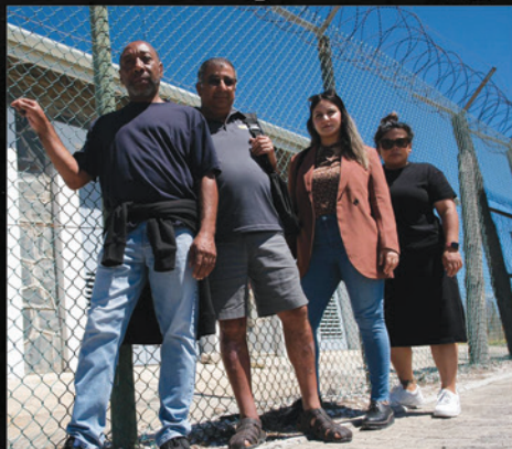
Les membres de la délégation Métallos à Robben Island, où Nelson Mandela a été emprisonné pendant 18 ans.

Depuis plus d’une décennie, le FHM donne son appui au groupe de ressources et d’information sur le travail dans le monde (ILRIG), qui a renforcé de façon déterminante la capacité des personnes et des organisations représentant les sans-emploi et les communautés défavorisées. Le groupe met à profit le vécu des collectivités, leur procure les outils dont ils ont besoin pour bien comprendre et analyser les structures du pouvoir en Afrique du Sud et dans le monde, et leur offre une formation