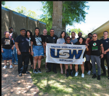
Les membres de la délégation Métallos avec le personnel d’ILRIG, à son école politique.