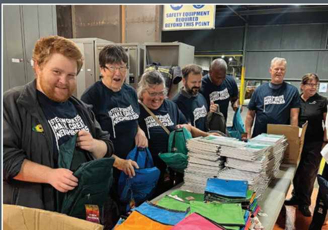
Des Métallos et d'autres bénévoles réunis dans les installations d'ArcelorMittal, dans l'est de Hamilton, pour remplir 1 500 sacs à dos en vue de leur livraison aux élèves de la région.

Partagez les contributions communautaires de votre syndicat sur les médias sociaux avec le mot-clic #metallossontla .