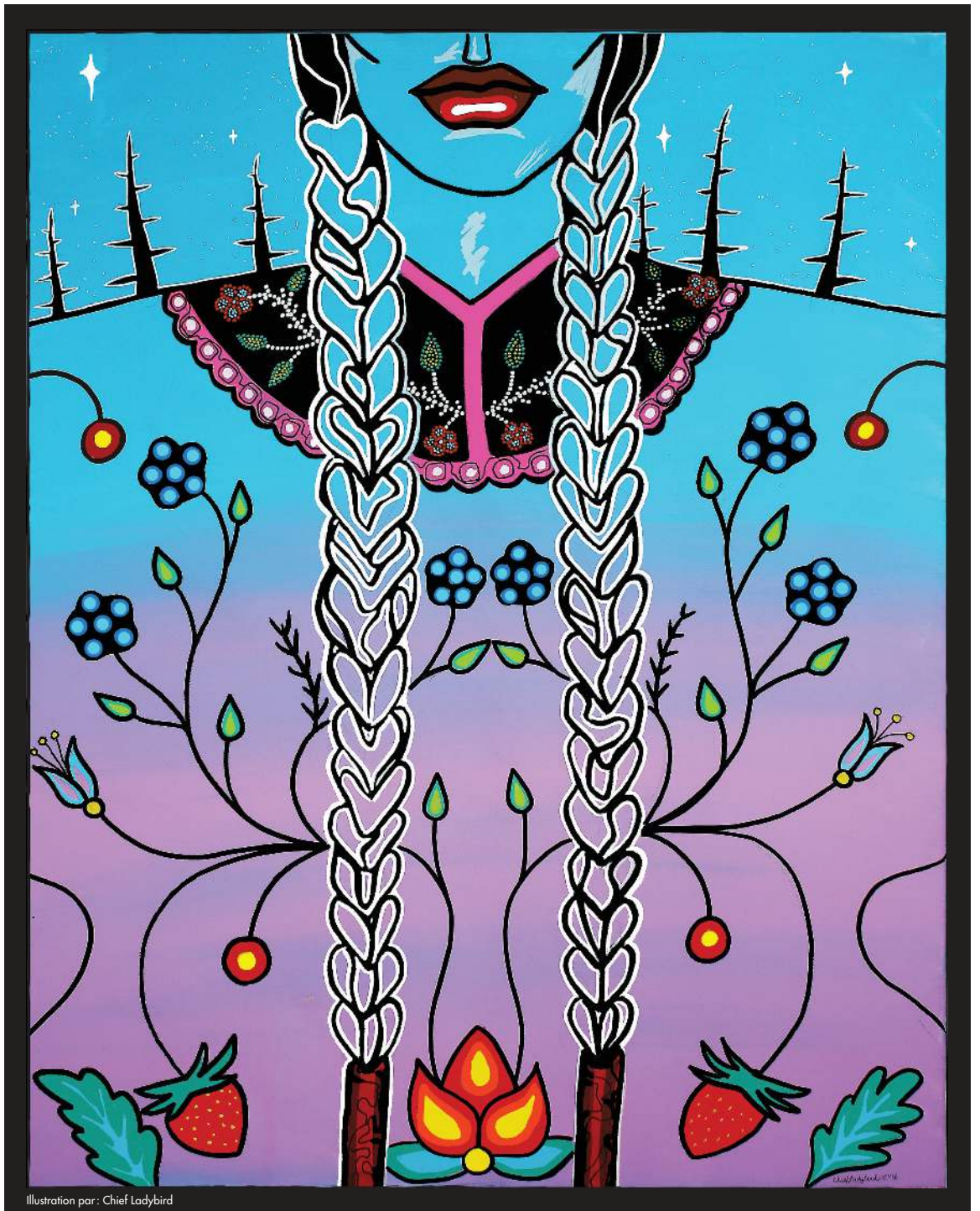
Illustration par: Chief Ladybird