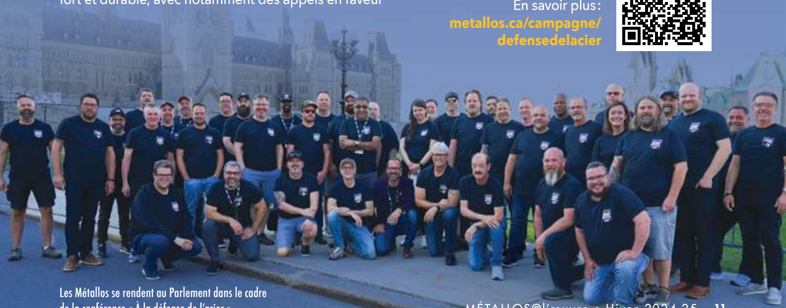
Les Métallos se rendent au Parlement dans le cadre de la conférence « À la défense de l'acier ».