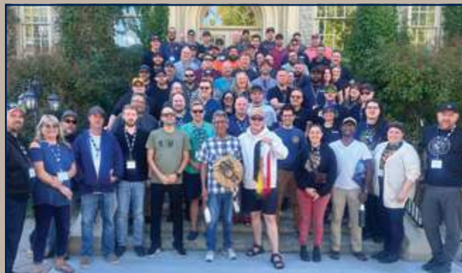
Les militant.e.s à l'école d'été du District 3 des Métallos à Cranbrook (C.-B.)