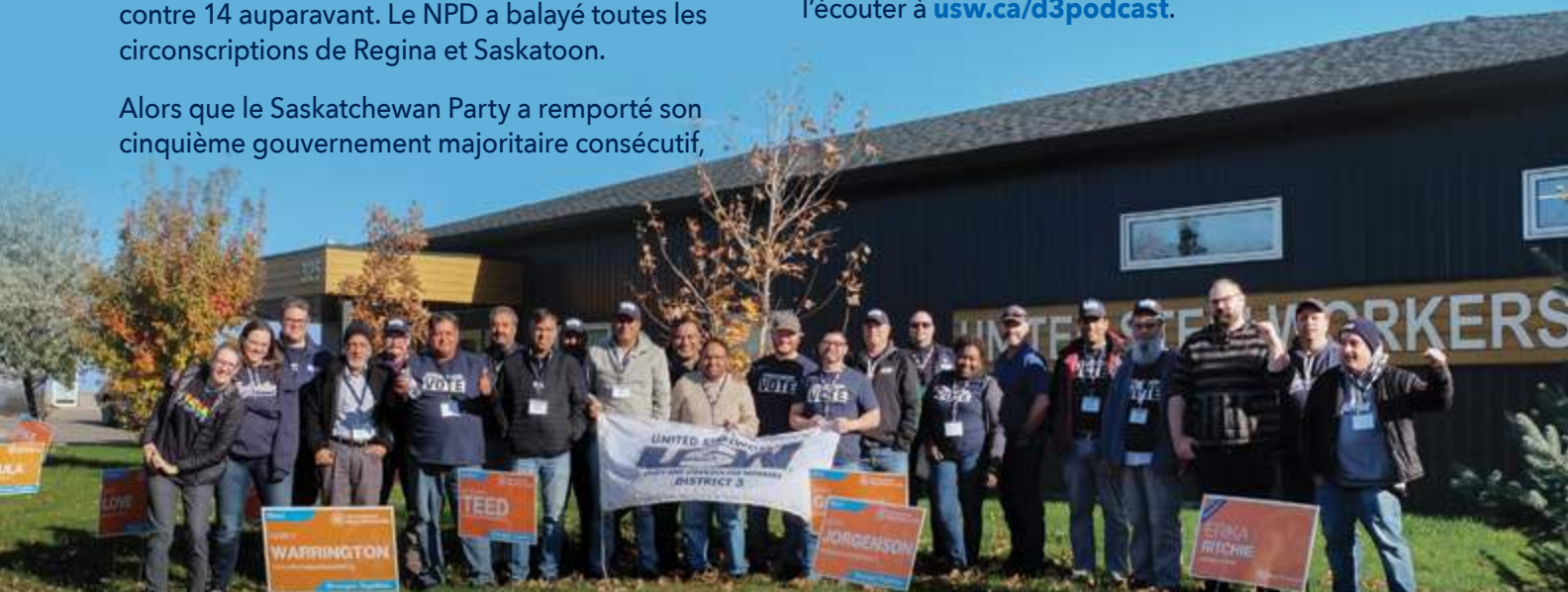
Des participant.e.s aux écoles Les Métallos votent devant le bureau syndical de Saskatoon.